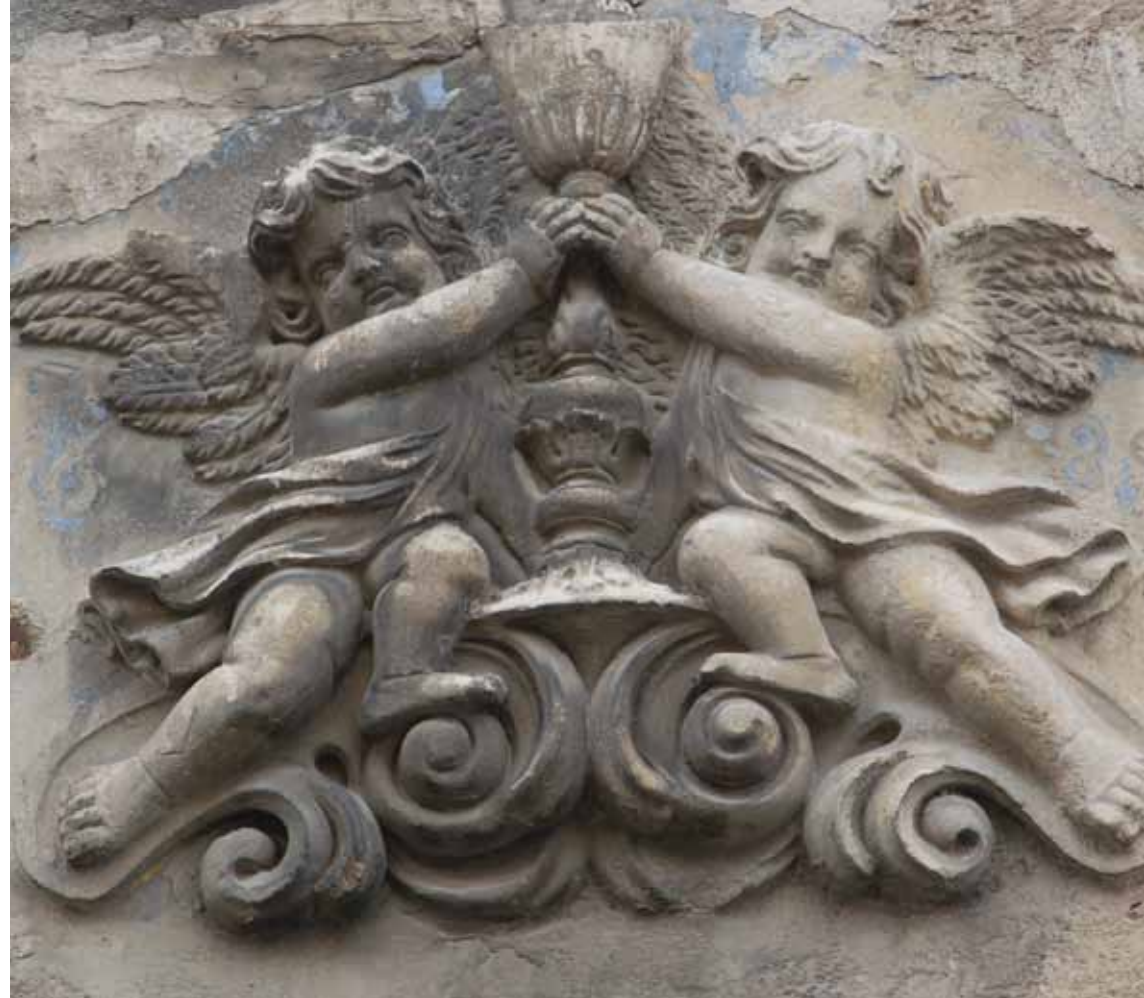
Détail Angelots Mur de l'église Saint-Nicolas - Façade rue Voltaire Pertuis

Bureau Municipal du Tourisme 04 42 77 90 27