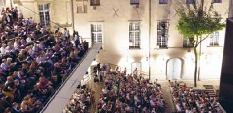
► Festival d'Aix-en-Provence