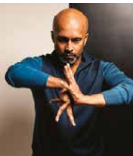
► Gigenis, The generation of the Earth Akram Khan

Poétique, expérimental, terriblement humain : l'art d'Akram Khan oscille perpétuellement entre danse contemporaine et danse de l'Inde, entre passé et présent. En témoigne son dernier opus Gigenis , au retour à son passé, ses racines, à travers l'évocation des mythes anciens et la tradition indienne.