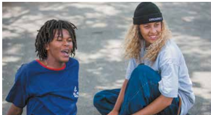
► Mid 90's

► Tous publics avec avertissement / Le climat qui met en scène un enfant et plusieurs scènes sont susceptibles de choquer un jeune public. Ce film mettant en avant le skateboard (discipline olympique depuis les Jeux Olympiques de Tokyo en 2021) et sa culture est présenté dans le cadre de la dynamique « Terre de Jeux » de la Ville d'Aix-en-Provence.