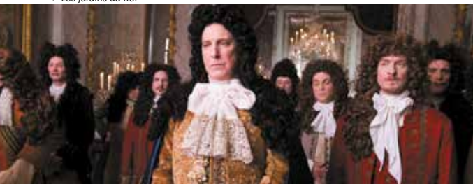
► Les jardins du Roi