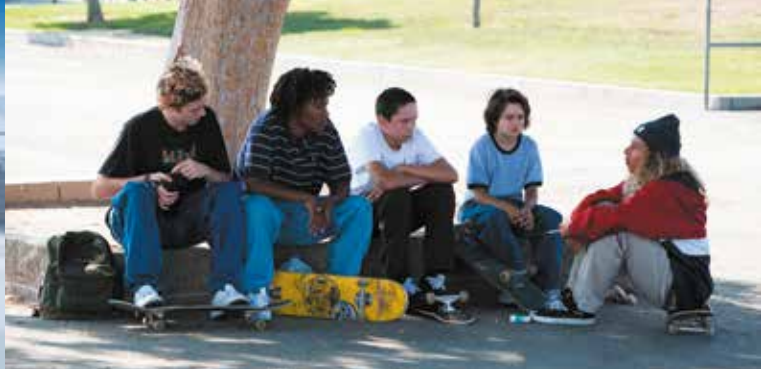
► Mid 90's