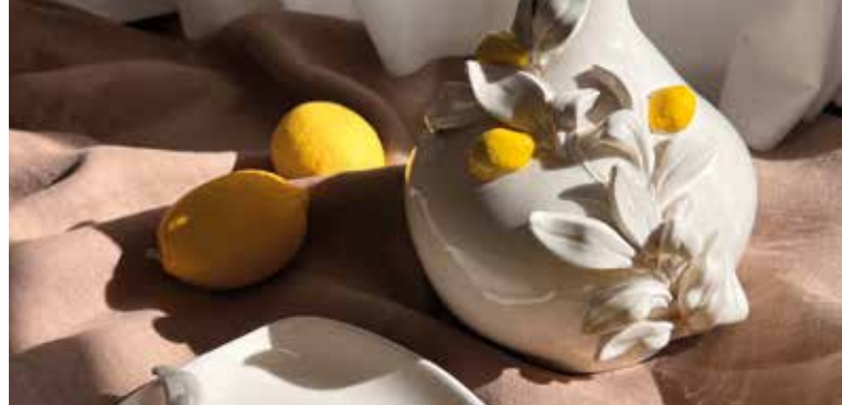
► Collection citron © Maison Bonjour