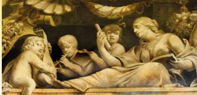
► Jean Daret La musique Décor du plafond de l'hôtel de Châteaurenard 1654

animationpavillon@mairie-aixenprovence.fr