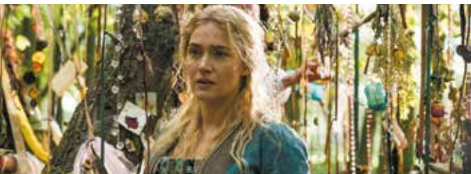
► Les jardins du Roi

Artiste aussi douée que volontaire, Sabine de Barra conçoit de merveilleux jardins. En 1682, son talent lui vaut d'être invitée à la cour de Louis XIV, où le célèbre paysagiste du roi, André Le Nôtre, fasciné par l'originalité et l'audace de la jeune femme, la choisit pour réaliser le bosquet des Rocailles.