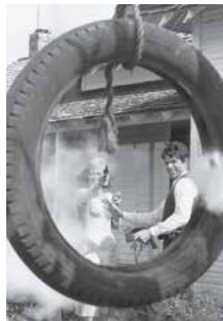
► Bonnie and Clyde