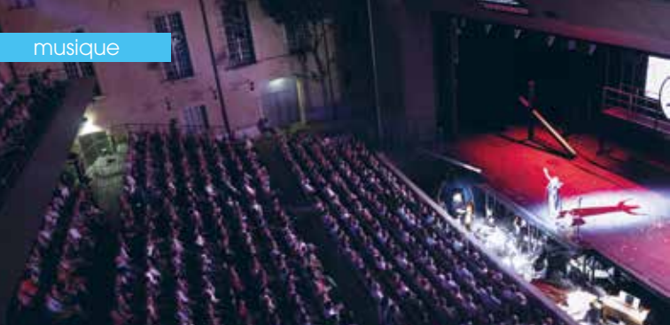
► Festival d'Aix-en-Provence