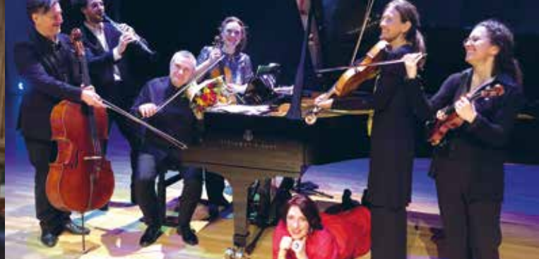
► © Inspiration d'Europe Central