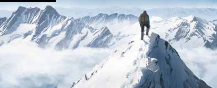
► Le sommet des dieux