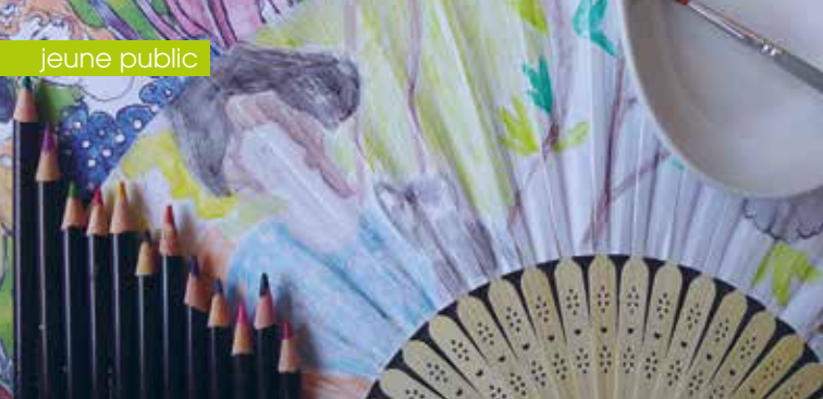
► Peinture sur éventail