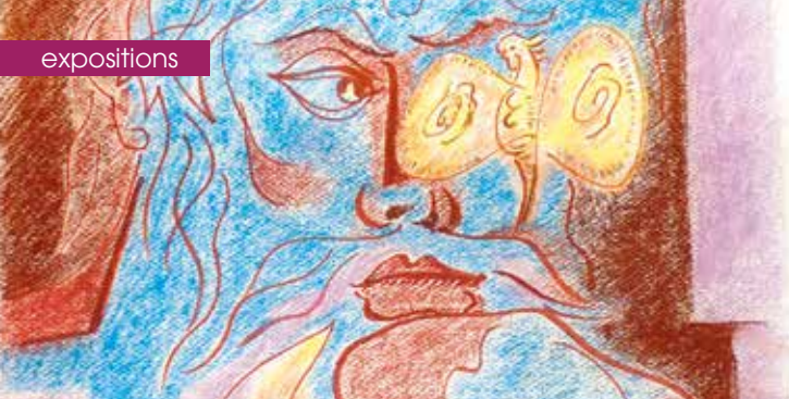
► © André Masson Le philosophe au papillon 1975