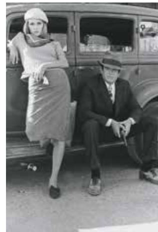
► Bonnie and Clyde