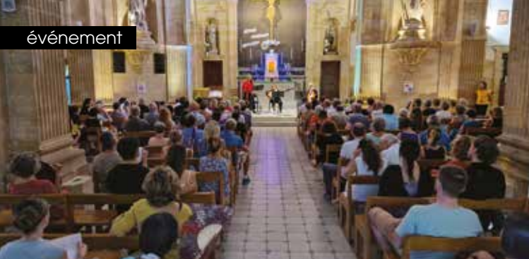
► Chapelle des Oblats