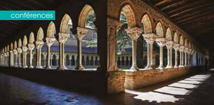
► Abbaye de Moissac