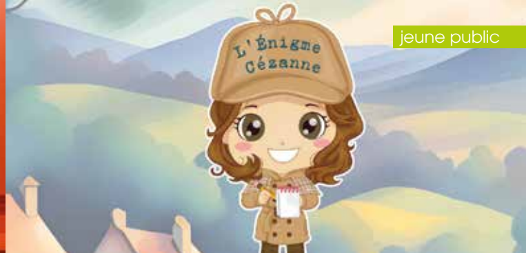
► Chasse au trésor L'Énigme Cézanne

Renseignements : 04 42 91 91 91 - lamanufacture-aix.fr