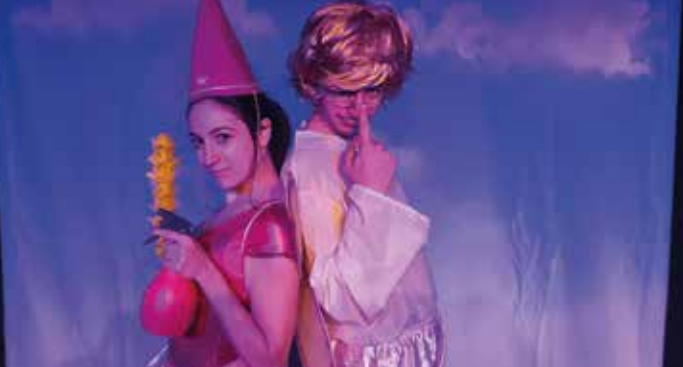
► Capitaine fée

Réervations : 04 42 59 19 71 - lamareschale.com