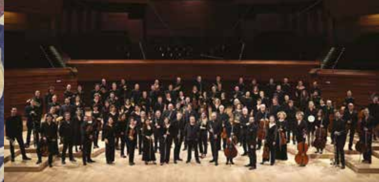
► Festival de Pâques, Orchestre philharmonique de Radio France