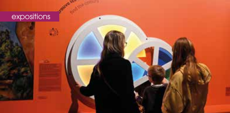
► La petite galerie Cézanne