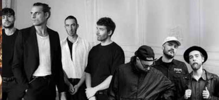
Dead Chic, Dirty Deep

► La Manufacture Cité du Livre 8/10 rue des Allumettes