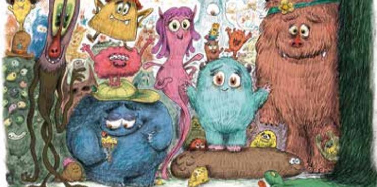
► Le monstre du placard © Bruno Salamone, édition Actes Sud Junior

► Et pendant la visite, un poster en relief est offert (dans la limite des stocks disponibles). À vous d'y dessiner JeanJambe pour voir le spéléologue se mettre en mouvement.