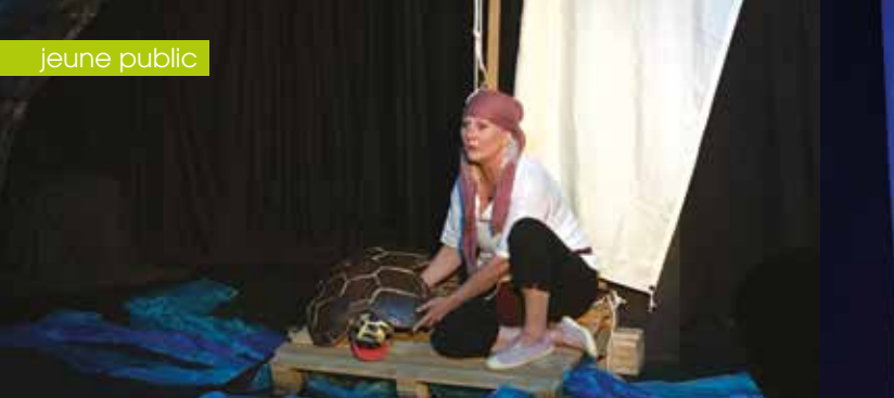
► Gardienne de la mer © La Famille - Laure Crochet Serniecloes - Alexandre Robitzer