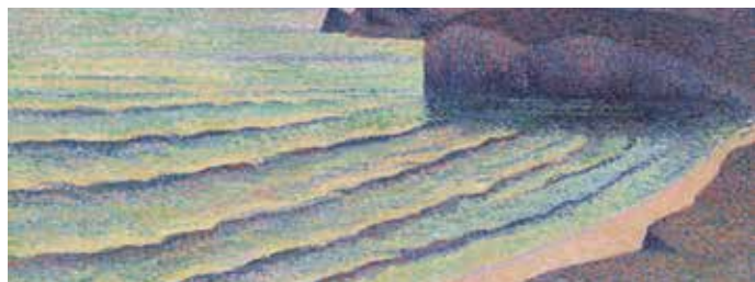
► Maximilien Luce, Bord de mer, la pointe du Toulinguet , 1893, Huile sur toile, 65 x 92cm Collection : Association des Amis du Petit Palais, Genève

► Caumont Centre d'Art 3 rue Joseph Cabassol Renseignements : 04 42 20 70 01 - caumont-centredart.com