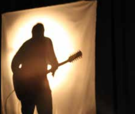
► Un Air de Liberté , Jean Didier Traina