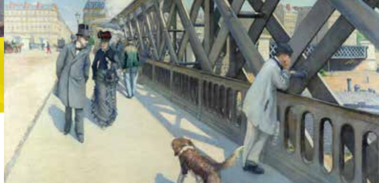
► Caillebotte, Le pont de l'Europe , 1876, Huile sur toile, 125 x 180 cm, Collection : Association des Amis du Petit Palais, Genève © Studio Monique Bernaz, Genève

► Théophile-Alexandre Steinlen, L'apothéose des chats à Montmartre , c. 1885, Huile sur toile, 164,5 x 300 cm Collection : Association des Amis du Petit Palais, Genève © Studio Monique Bernaz, Genève