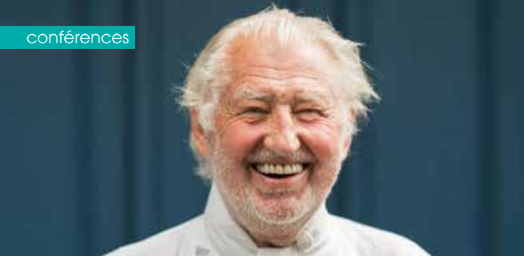
► Pierre Gagnaire