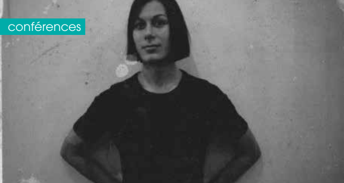
► Yvonne Rainer