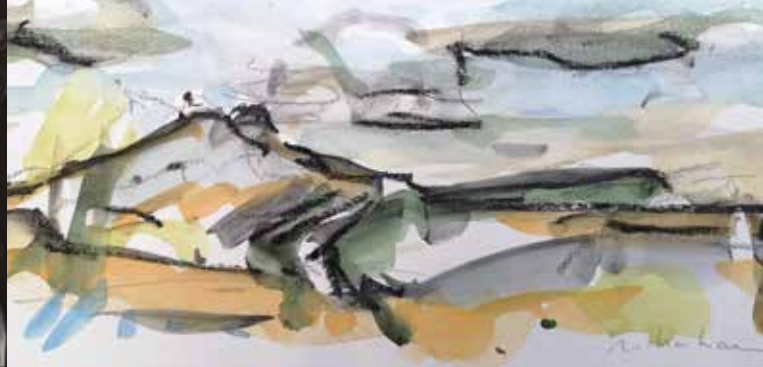
► Sainte-Victoire , aquarelle et fusain sur papier 15 x 33 cm © Miriam Hartmann