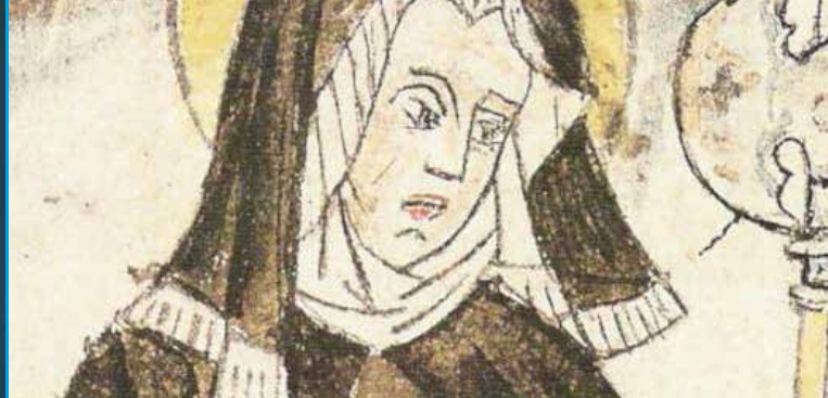
► Sainte Wiborade (détail) © Bibliothèque de St-Gall, Cod. Sang. 586, Les Amis de la Méjanas

► Brasserie Aqua Maltae rue de l'Ancienne Minoterie Renseignements : aphg.aixmarseille@gmail.com