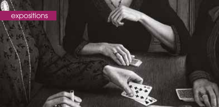
► Partie de jeu entre ami-e-s