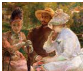
► Marie Bracquemond, Sur la terrasse à Sèvres , 1880, Huile sur toile, 88 x 115 cm Collection : Association des Amis du Petit Palais, Genève.

de l'art, reflète tant la vision et le goût d'un collectionneur (guidé par sa passion, sa curiosité, son intuition) que l'audace picturale qui traversa une époque des plus inventives. À travers un choix d'œuvres aussi exigeant qu'éclectique, Ghez ne s'est pas contenté d'individualiser les grandes tendances de la modernité : il a su, avec une vision fulgurante, saisir les moments de bascule, les instants où la peinture s'invente un nouveau langage. En parcourant l'exposition, nous suivons à la fois l'évolution des styles et le regard d'un homme qui,