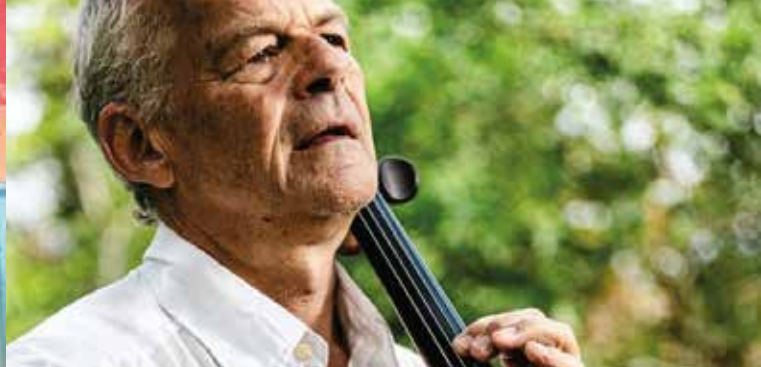
► Concert Duo Violoncelle Guitare, Dominique de Willencourt

Renseignements : 04 42 23 45 65 - choeurcantabile.org