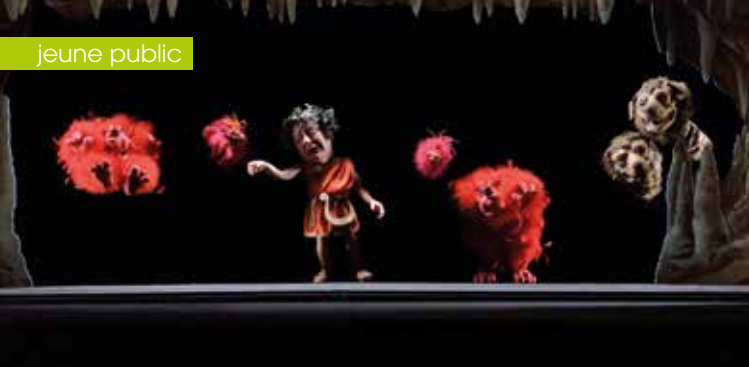
► Petite balade aux enfers