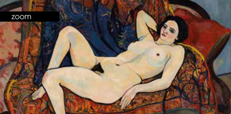
► Suzanne Valadon, Nu au canapé rouge , 1920, Huile sur toile, 80 x 120 cm Collection : Association des Amis du Petit Palais, Genève