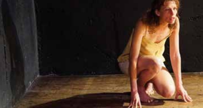
► L'homme assis dans le couloir

Réservations et billetterie : lipaix.com