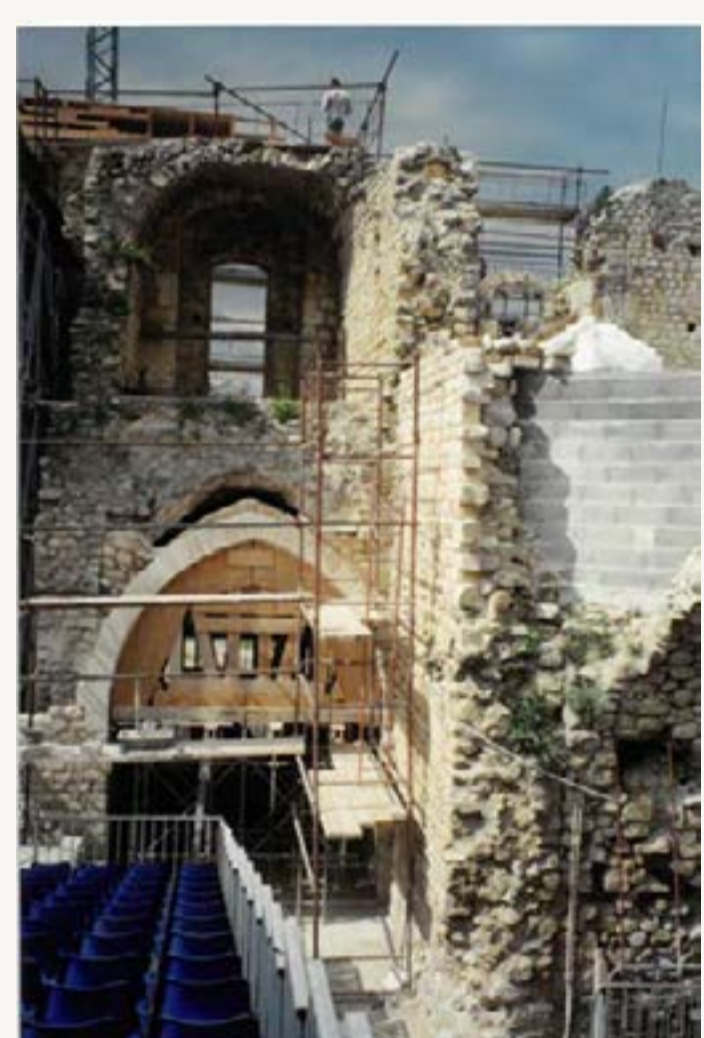
3 : Couloir d'entrée - Remontage de l'arc côté cour intérieure