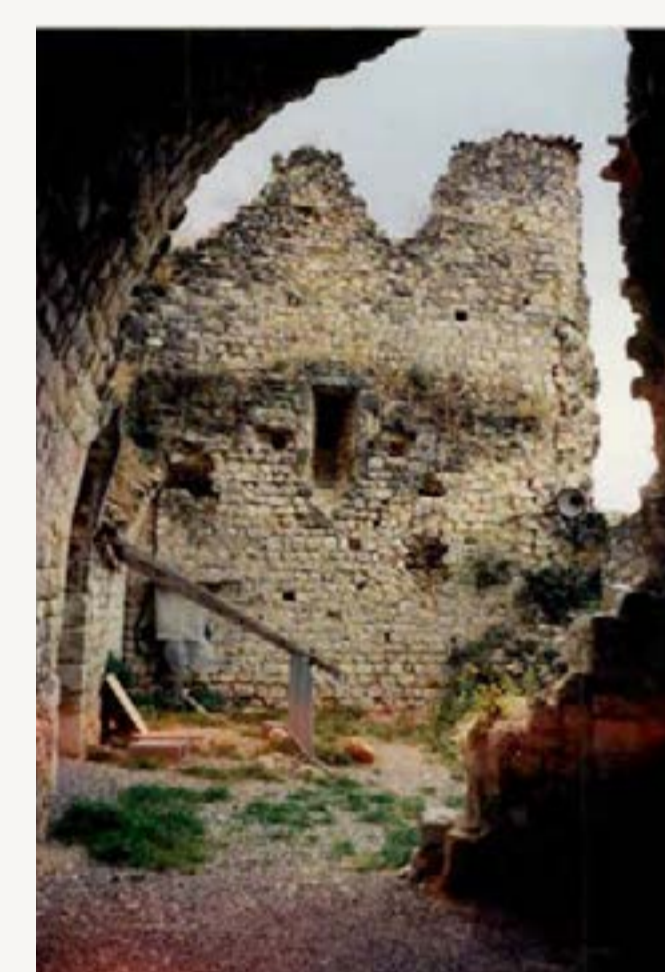
2 : Salle basse de l'aile Ouest - voûte conservée en premier plan