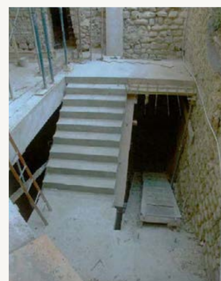
3 : Volée d'accès au niveau du rez-de-chaussée