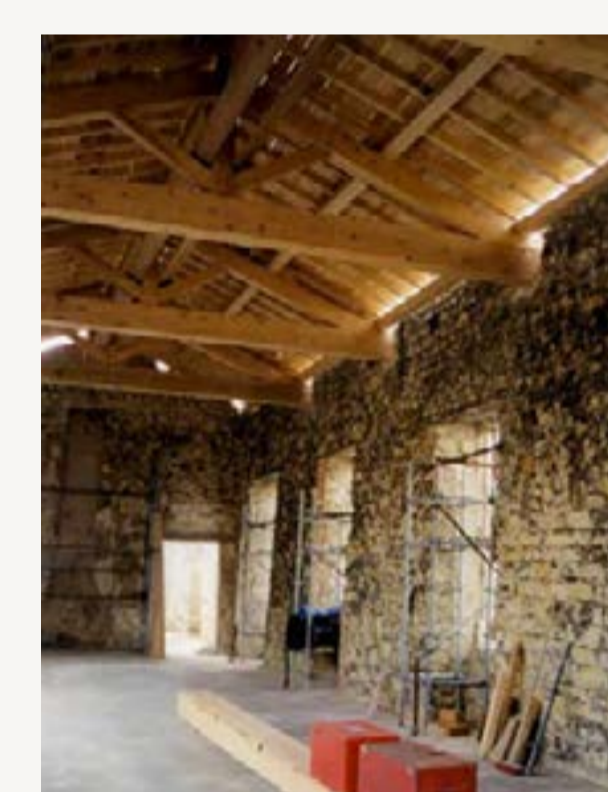
6a : Vue intérieure toiture en cours