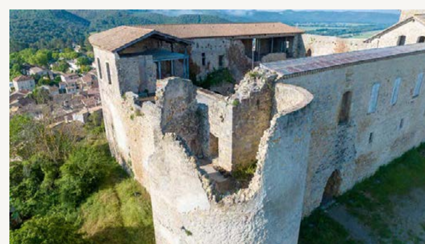
Tour Nord-Est avant travaux