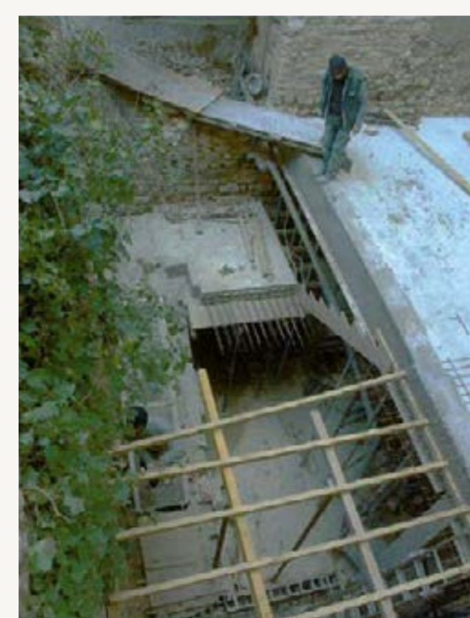
3 : Construction en cour de l'escalier entre le niveau -1 et le rez-de-chaussée (préparation de la 2 ème volée)

Dernière grande phase de sauvetage et mise hors d'eau du château, cette campagne aura permis de créer un accès aux différents niveaux du château par la mise en place d'un élément de circulation verticale dans l'angle Sud-Est. Au surplus, des paliers intermédiaires sont créés et l'ensemble est abrité par une toiture qui constitue l'amorce d'une future couverture de la terrasse Est.