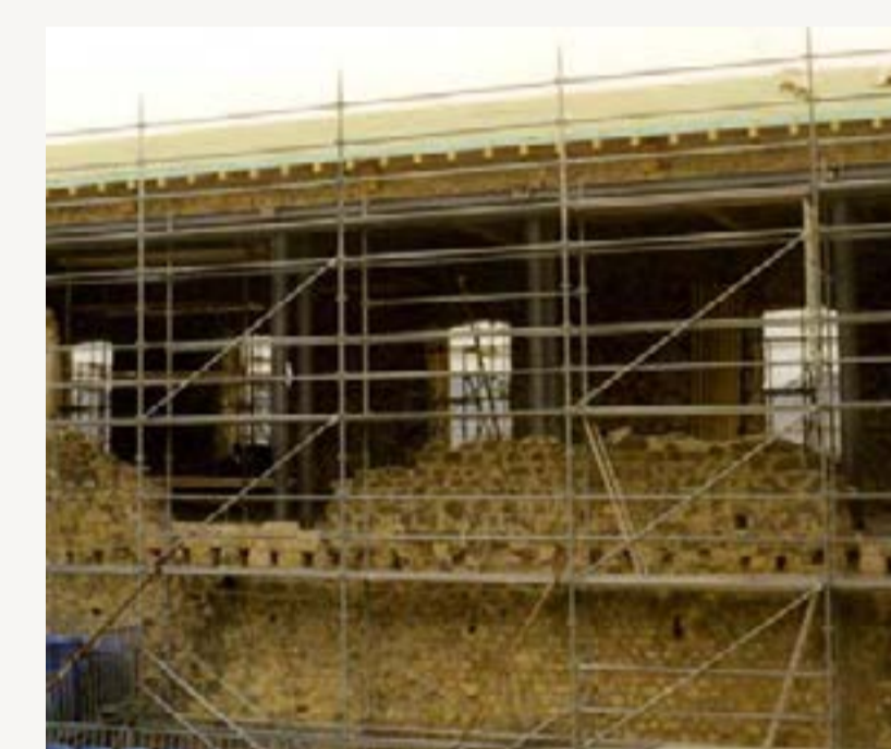
6b : Vue depuis la cour toiture en cours

Les évolutions engagées lors de cette campagne portent essentiellement sur l'aile Est et l'angle Sud-est. La toiture réalisée lors de la précédente campagne de travaux est prolongée dans l'angle Sud-Est afin de mettre hors d'eau les espaces situés à l'aplomb. Dans le même temps, la troisième salle voûtée sous l'aile Est est reconstituée ainsi que son parement en façade côté cour du château.