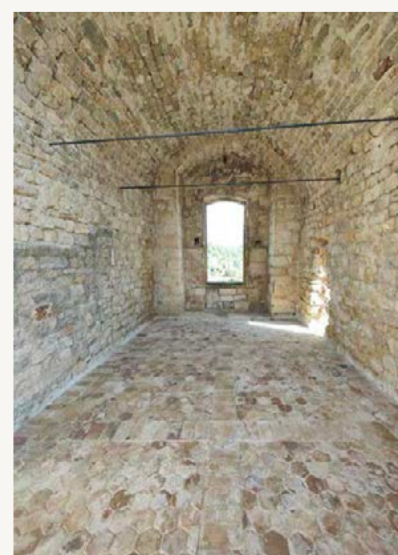
Voûte et terrasse nord rrestaurées

4 / La restauration du sol en terre cuite de la salle de la herse a été réalisée en parallèle de la reconstitution de la voûte située à l'aplomb. Cette dernière, constituée de moellons de pierre a pu être rebâtie en tenant compte de la présence d'une amorce côté Nord, venant ainsi protéger des intempéries le sol en terre cuite restauré.