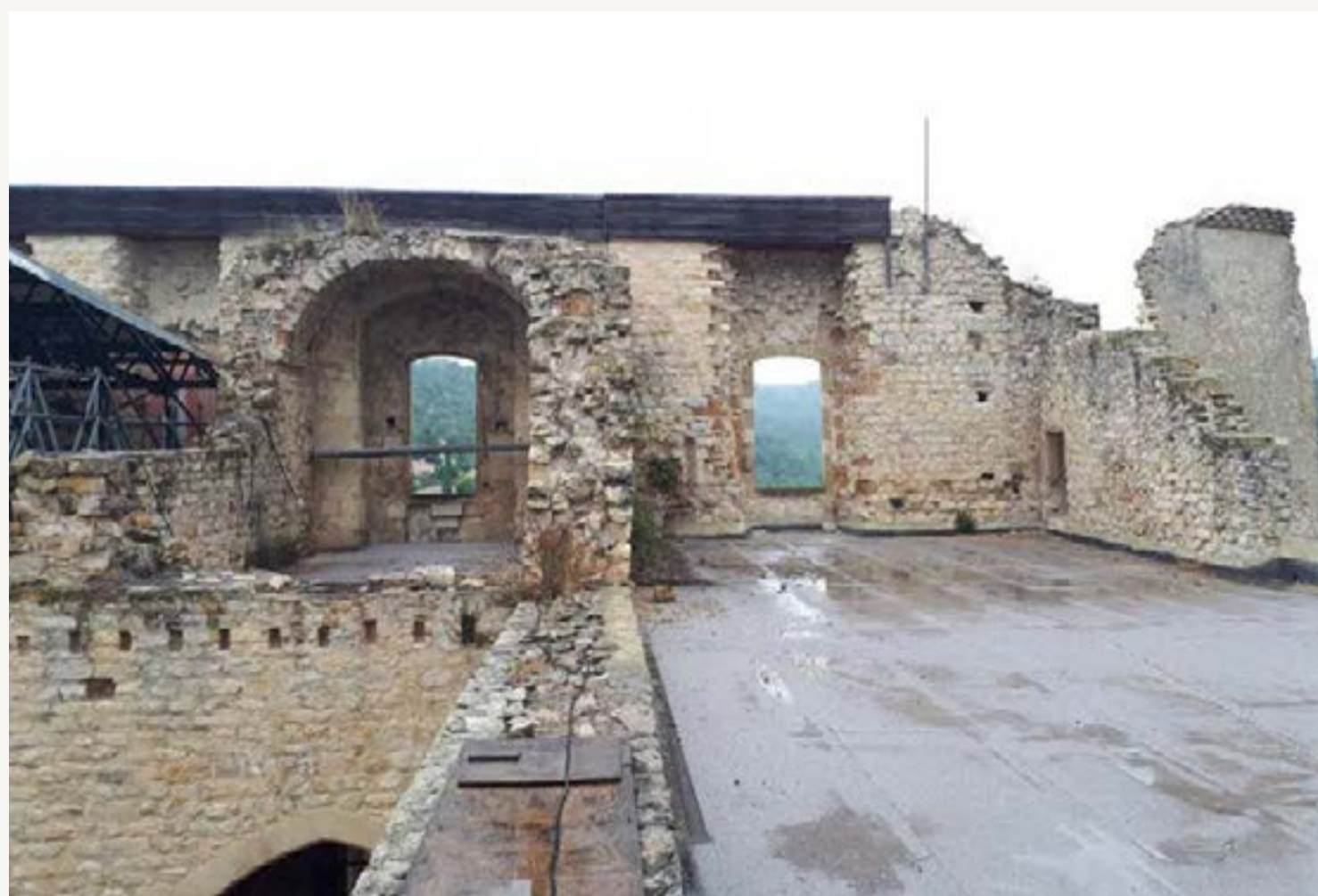
Terrasse Est avant

Ces espaces pourraient à terme être employés à des fins multiples telles que des expositions, séminaires, conférences, etc.