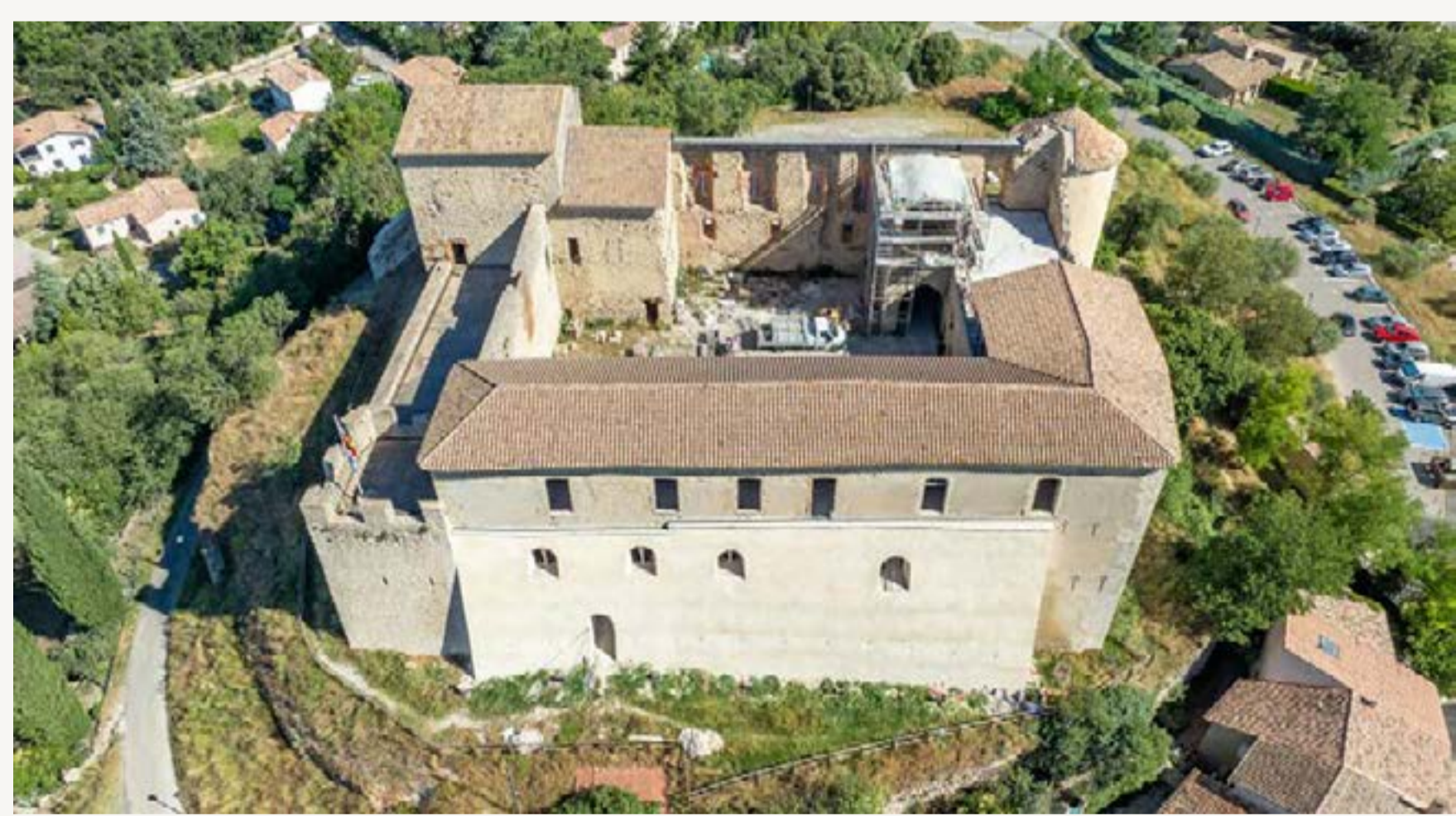
Glacis de la façade Sud

3 / La restauration du glacis en façade Sud et reconstitution des baies géminées à coussièges. Les travaux de reprise du glacis de la façade Sud ont mis en évidence la présence de traces de baies géminées telles qu'elles ont pu exister par le passé. Afin de mettre en valeur ces ouvertures visibles depuis le village, l'ensemble de ces baies a été restauré avec minutie. Trois colonnes centrales coiffées chacune d'un chapiteau ont été implantées dans l'axe médian de chacune des baies. Les coussièges situés à l'arrière ont également été restaurés.