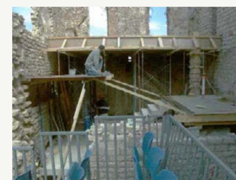
3 : Coffrage de la dalle de niveau 2 et de l'escalier