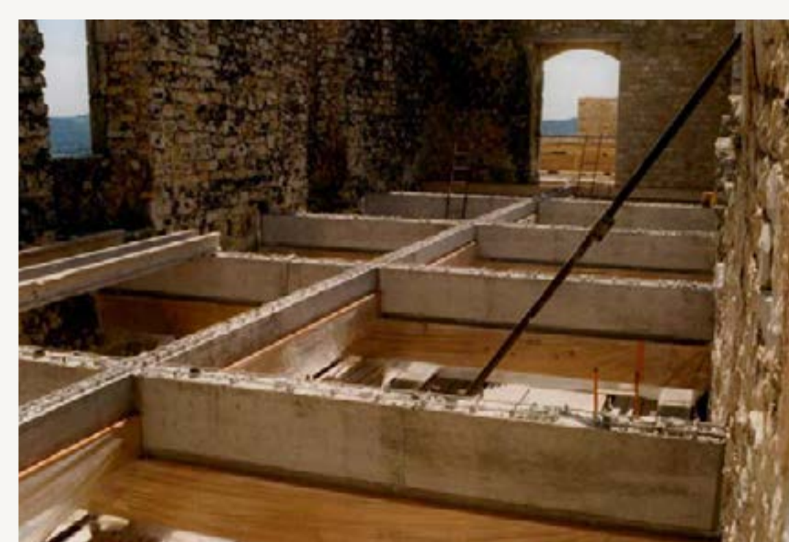
5a/5b : Ossature béton armé

Visible depuis le village, l'aile Sud va profondément se métamorphoser durant cette campagne de travaux et va être couverte d'une charpente en bois stabilisée par un portique en acier ainsi que d'une couverture définitive en tuiles canal. Un plancher mixte en bois-béton intégrant un système de plancher chauffant est réalisé au dernier niveau de cette aile. Alors que la suppression du glacis est initialement envisagée, le risque d'instabilité de cette zone déjà fortement remaniée va œuvrer pour son maintien.