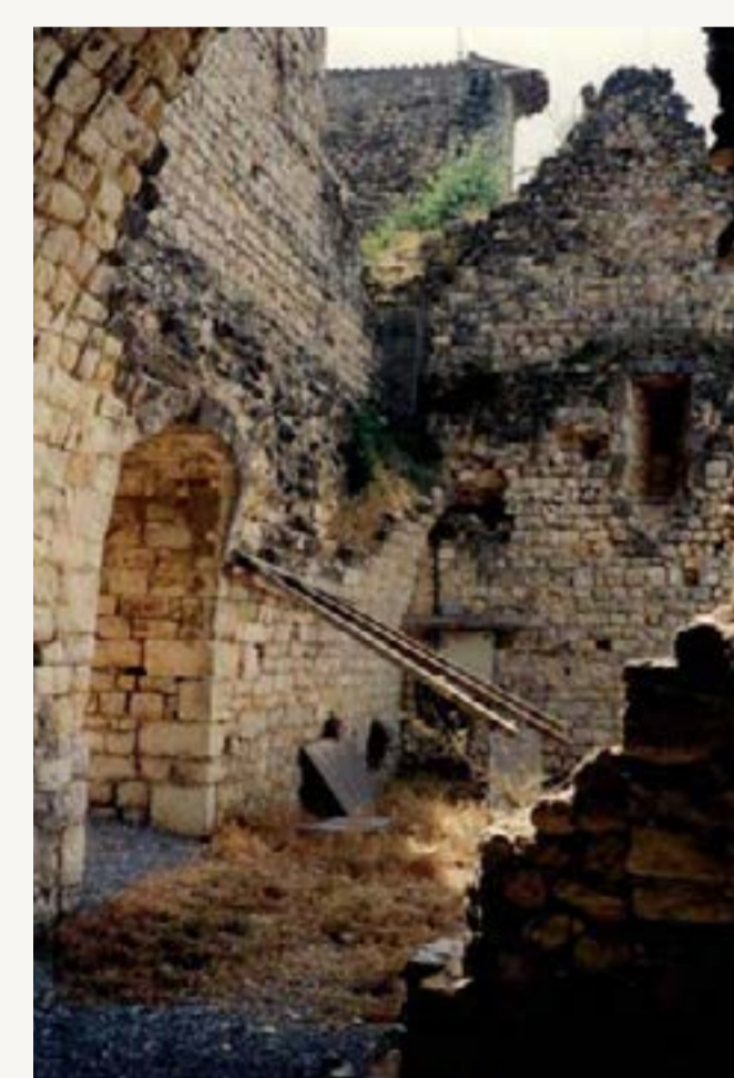
1 : Salle basse de l'aile Ouest - arrachement de la voûte sur le mur Est (Juin 1989)