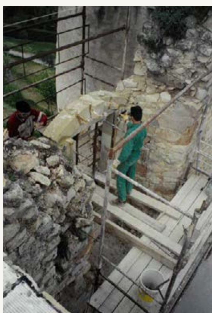
4 : Ancienne cuisine - Aile Est, Voûture de fenêtre en remontage

Durant ces deux années, les opérations de sauvetage vont se poursuivre sur la totalité de l'édifice. Les premières interventions sur l'aile Est vont assurer une mise hors d'eau des deux salles voûtées en intégrant la protection des sols en terre cuite. Au niveau de l'entrée principale et de l'aile Nord, l'arc en pierre de taille est restitué ainsi que la baie effondrée contre la tour circulaire Nord-Est. Les maçonneries sont rejointoyées et une protection en plomb vient assurer l'étanchéité au-dessus des génoises rebâties. Sur l'aile Ouest, les travaux se poursuivent afin de rendre utilisables les deux salles pour des expositions. La tour Sud-Ouest enfin est également restaurée : restitution de l'ouverture entre l'aile Sud et la tour, reprise du crénelage caractéristique et création d'une dalle étanche au sol.