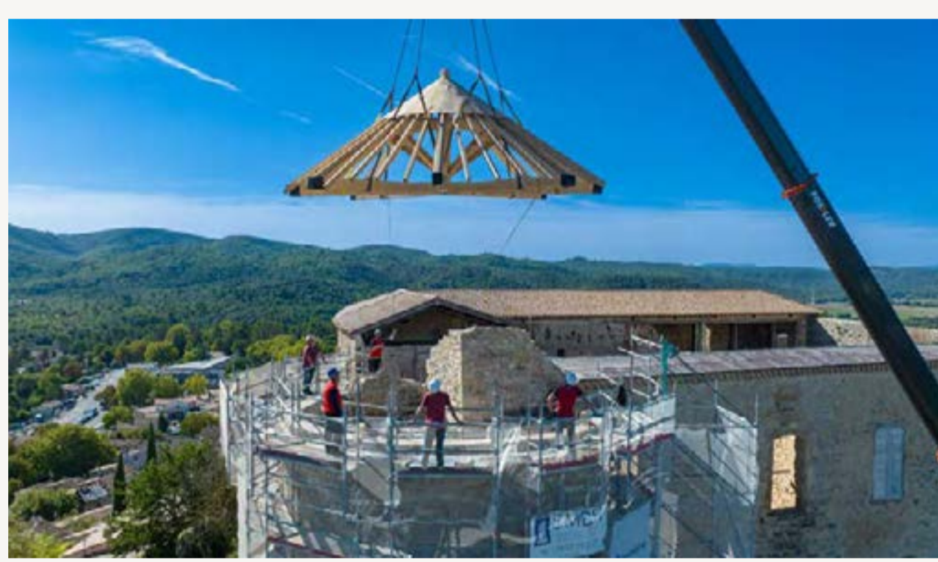
Levage de la charpente

1 / La restauration et mise hors d'eau de la tour nord-est a été réalisée sur la base d'éléments historiques permettant d'avoir une idée précise de la volumétrie d'origine de la tour. Cette dernière s'était fortement dégradée au fil des intempéries et par un impact de foudre.