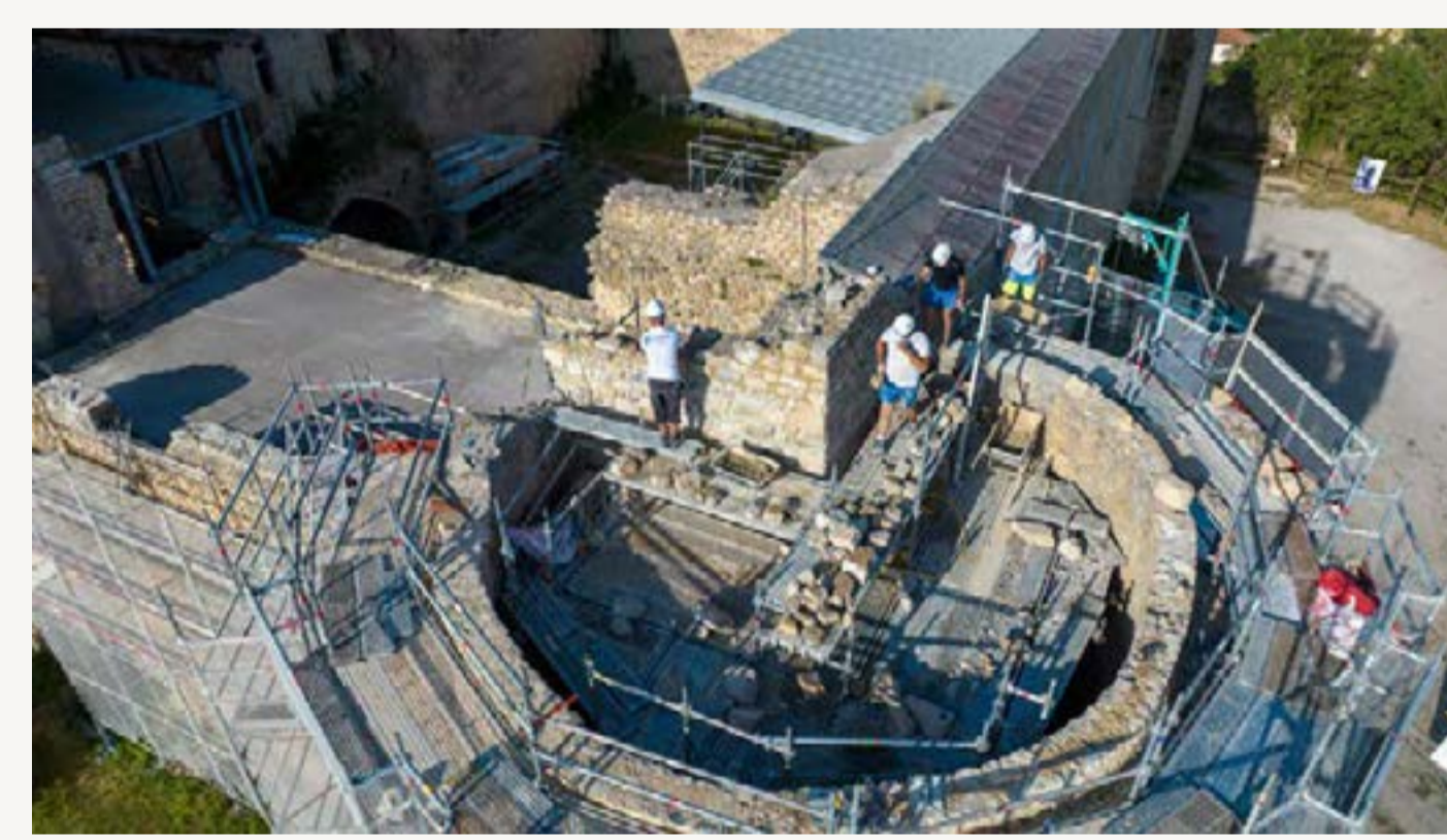
Travaux tour Nord-Est