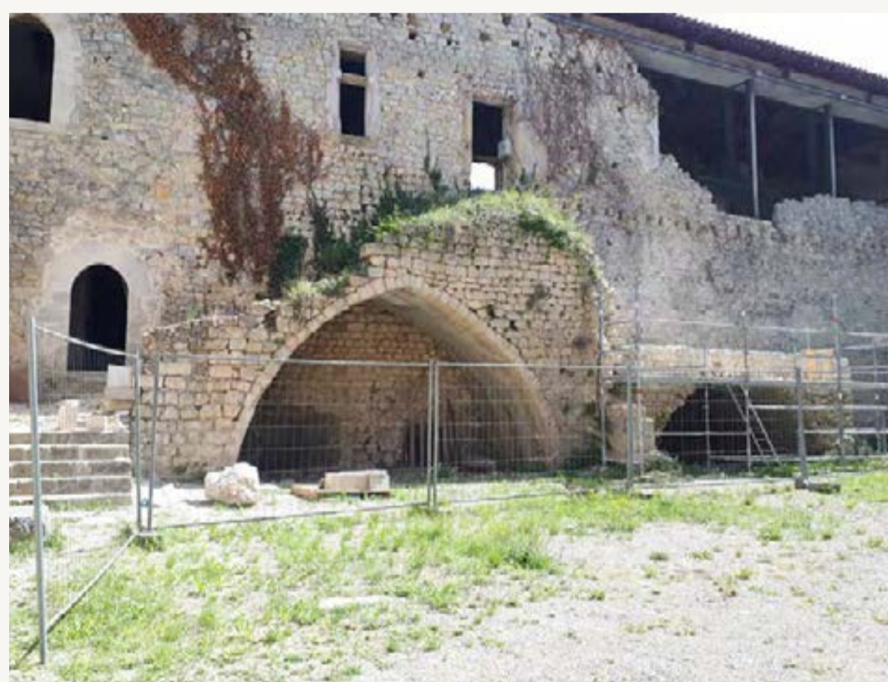
Escalier avant travaux

2 / La restauration de l'escalier de la cour d'honneur qui a souffert d'une dégradation progressive au cours de ce siècle. L'escalier d'origine, dont les vestiges de marches étaient identifiables, a pu être restauré dans une logique fonctionnelle pour un réemploi à long terme.