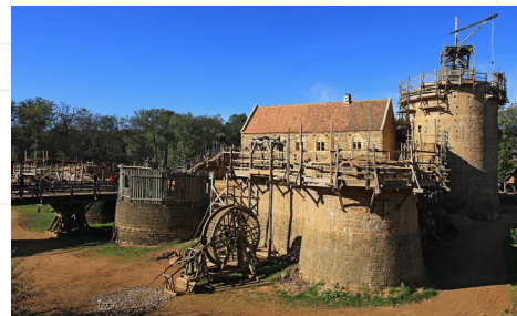
À Guédelon (Département de l'Yonne), des archéologues et des artisans travaillent depuis 1997 à la construction d'un château-fort comme au Moyen Age . Sur ce chantier unique, les techniques de construction médiévales sont testées et présentées au public.