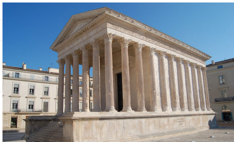
À Nîmes, ancienne Nemausensis, « la Maison Carrée » âgée de plus de 2000 ans est très bien conservée en centre-ville. Située au centre du forum romain, il s'agit d'un temple dédié au culte de l'Empereur.

As-tu déjà visité un temple romain ou un château-fort ?